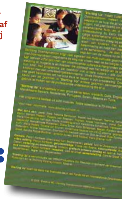
Starting Up, Early Intervention bij Downsyndroom. Wegwijs in de hulp die ouders voor hun kind kunnen krijgen. In tien talen ondertiteld. Prijs 15 euro (zie webwinkel pagina 62).

Bij de professionals stond voorafgaand aan het bekijken van de DVD 43 procent zeer positief tegenover Early Intervention. Dit waren de drie zorgaanbieders. De overige vier professionals waren neutraal (2x) of hadden geen mening (2x). Na afloop van het bekijken van de DVD was nog steeds 43 procent zeer positief en waren de overige 57 procent positief over Early Intervention.