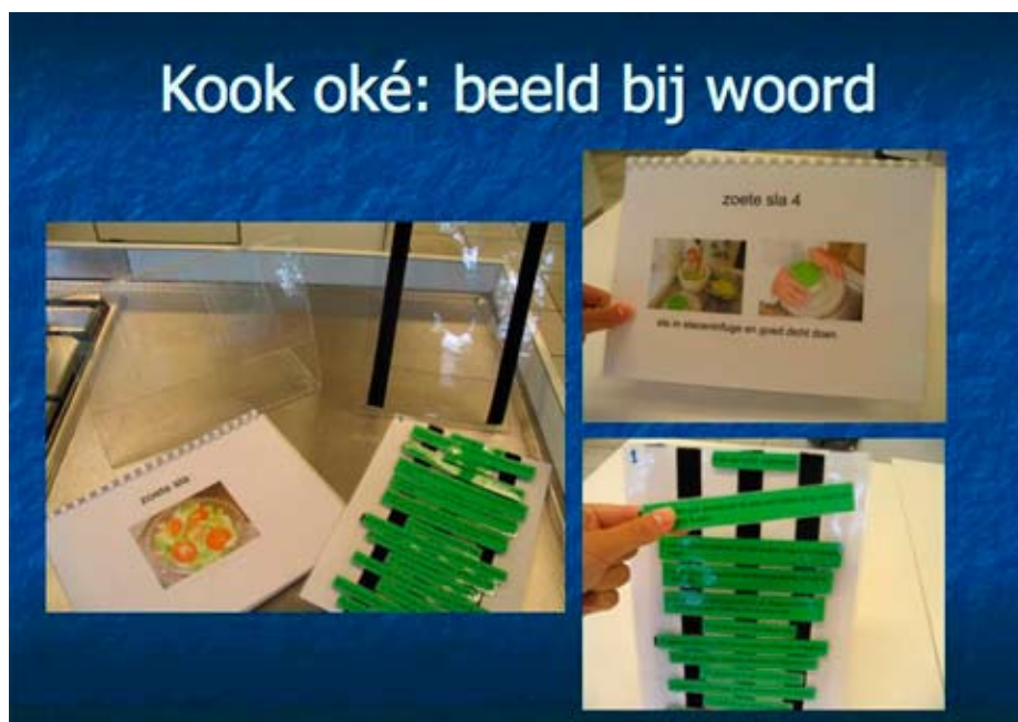
Visuele instructie werkt voor veel leerlingen uitstekend.

Rondleiding: in de interne stage kamer staat een kast met laatjes. Op ieder laatje bevindt zich een foto, vaak met korte tekst erbij, bijvoorbeeld 'pullenbak